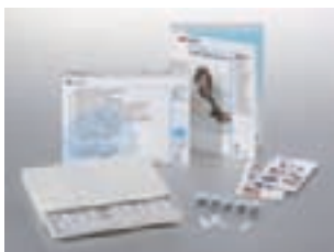
Protemp Crown, zestaw wprowadzający